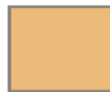
Terra di Siena